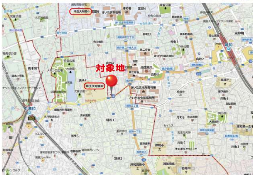
選択可能校として国立埼玉大学教育学部附属小学校・中学校も徒歩圏内です。