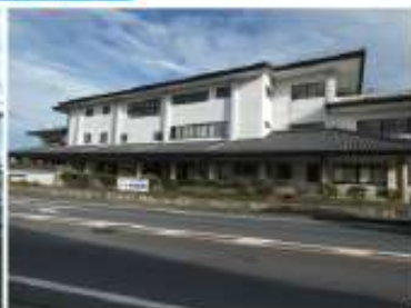
市立国府南小学校