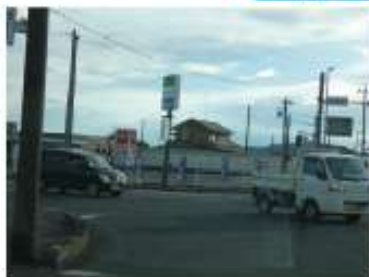
ファミリーマート